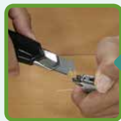
③カッターの下からライターで炙ります。