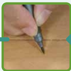
⑤木目をマニキュアで再生します。