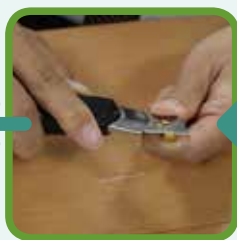
②カッターの上に、かくれん棒の削りかすをのせます。