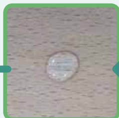
②へこみに、濡らしたティッシュから水滴を落としてしばらく待ちます。(1～2時間)