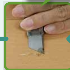
④カッターをヘラのように使ってキズの上からなでつけます。すこし乾いたら周りについた色のカッターでこすり落とし、乾いた布で拭き取ります。