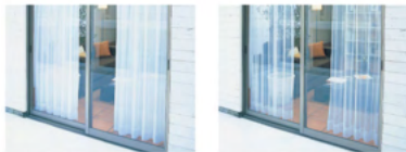
ミラーレース 一般レース

家族や友人とプライベートな時間を過ごす部屋なので、シルエットが外に見えないようミラーレースや厚地のものがおすすめです。