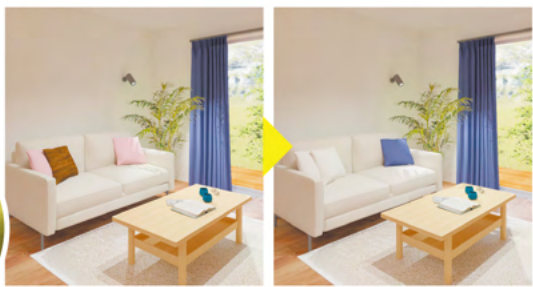
カーテンのみ クッションも同じ生地に

あまり知られていませんが、オーダーカーテン生地でもクッションカバーを作ることができ、簡単に部屋全体をコーディネートできます。